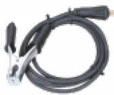
Pinza de tierra