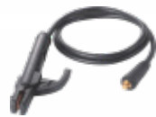
Pinza porta electrodo